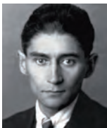
Franz Kafka, 1923

Vor hundert Jahren ist Franz Kafka gestorben, der auch ein großartiger Witzeerzähler war. Wie berichtet wird, musste er etwa die Lesung seines Romans „Der Prozess“ wegen Lachanfällen immer wieder unterbrechen. „Des Scherzens und Lachens war kein Ende“, schrieb sein Freund Max Brod. Kafkas Komik, die den Abgrund unter sich weiß und aus der Verzweiflung geboren wird, ist